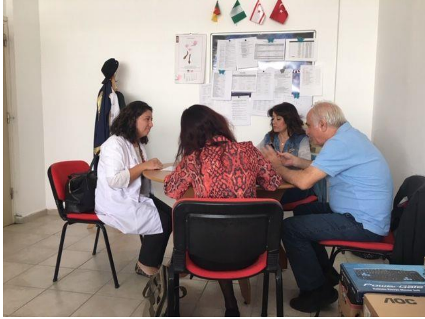
Şekil 3. Sözlü Staj Sınavından bir görünüm.