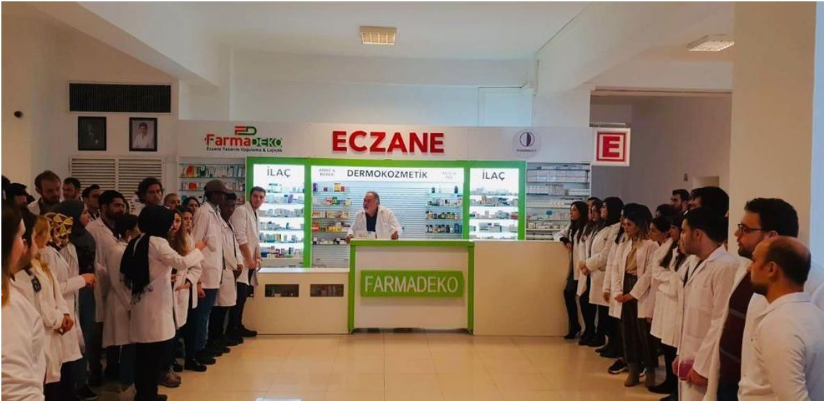
řekil 2. YD Eczacılık Fakltesi "Simlasyon Eczanesi" (2. Katta yer almaktadır)