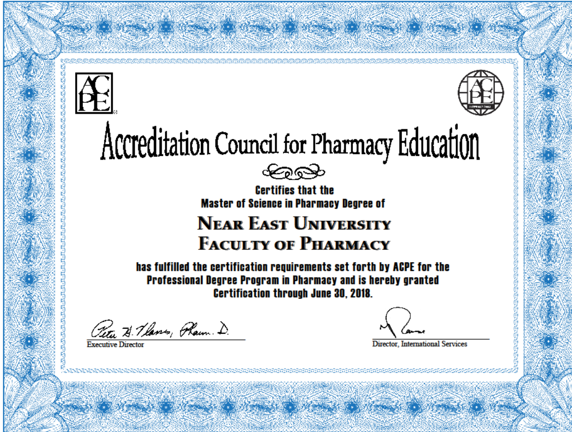
Şekil 1. Accreditation Council for Pharmacy Education (USA) certificate.