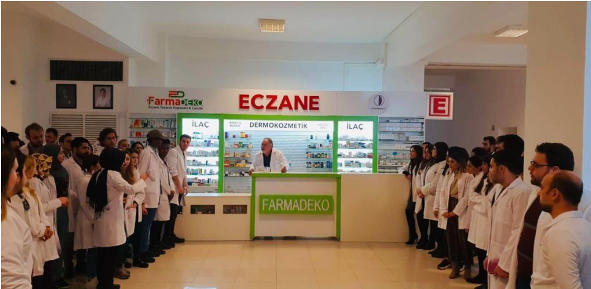
Şekil 3. YDÜ Eczacılık Fakültesi Sanal Eczanesi 2. Katta bulunmaktadır.