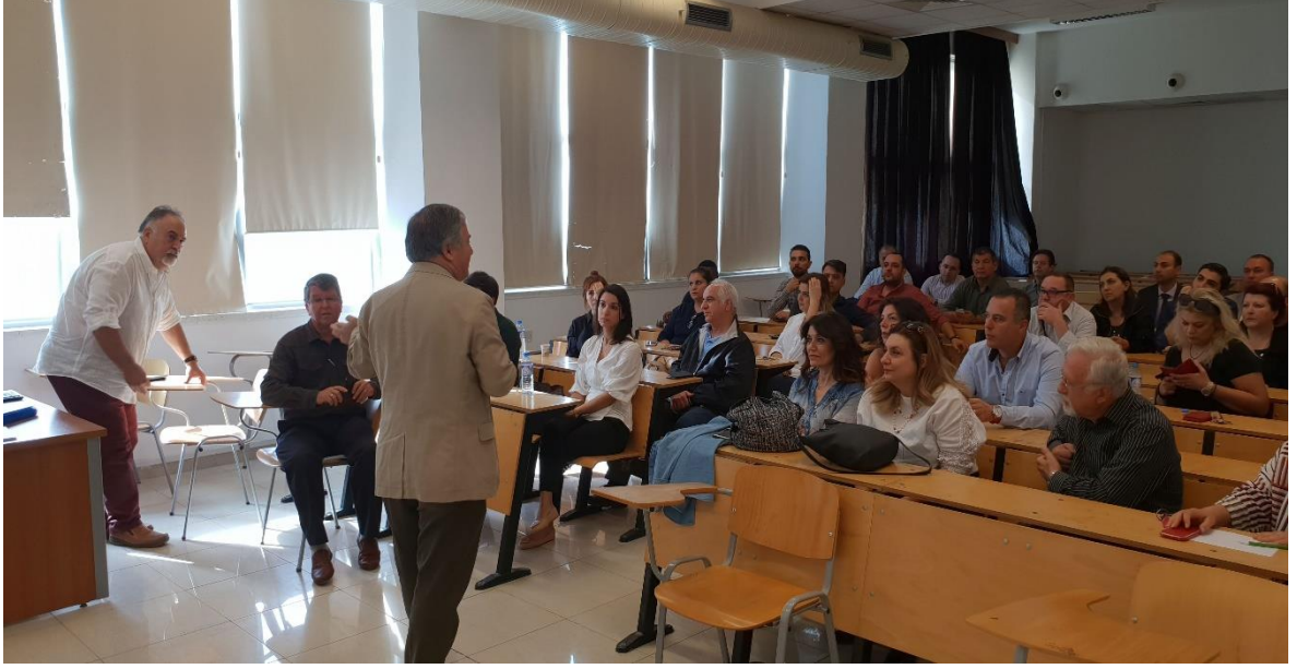
Şekil 6. Staj Sözlü sınavı başlamadan önce jüri üyeleri ve preseptörler ile yapılan bir toplantı.