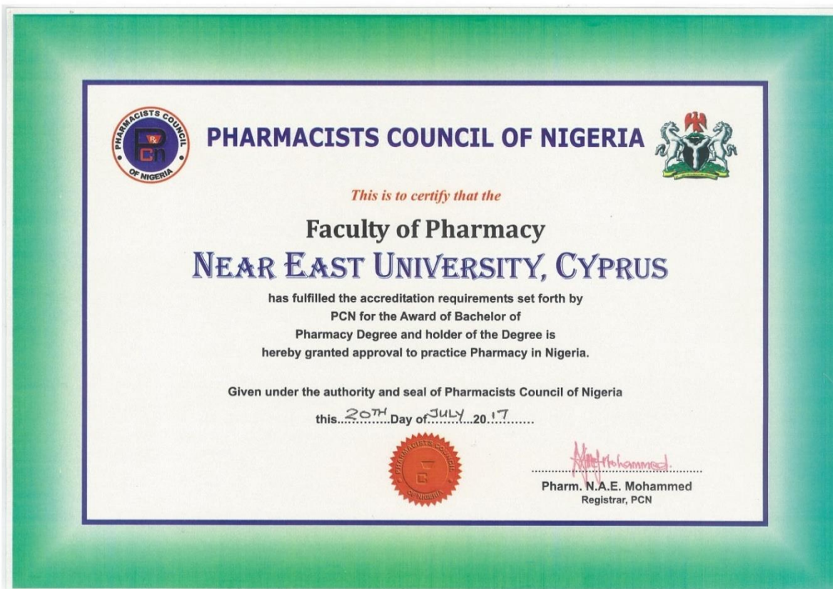
Figure 2. Pharmacists Council of Nigeria certificate.