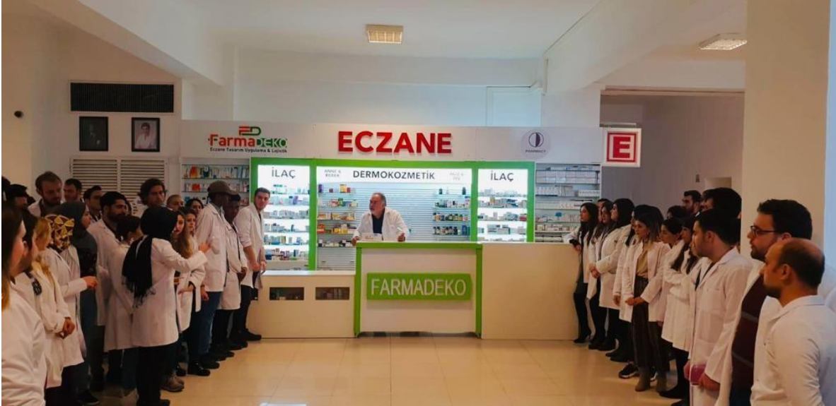
Figure 3. NEU Faculty of Pharmacy “SIMULATION PHARMACY” (Located at the 2nd floor)