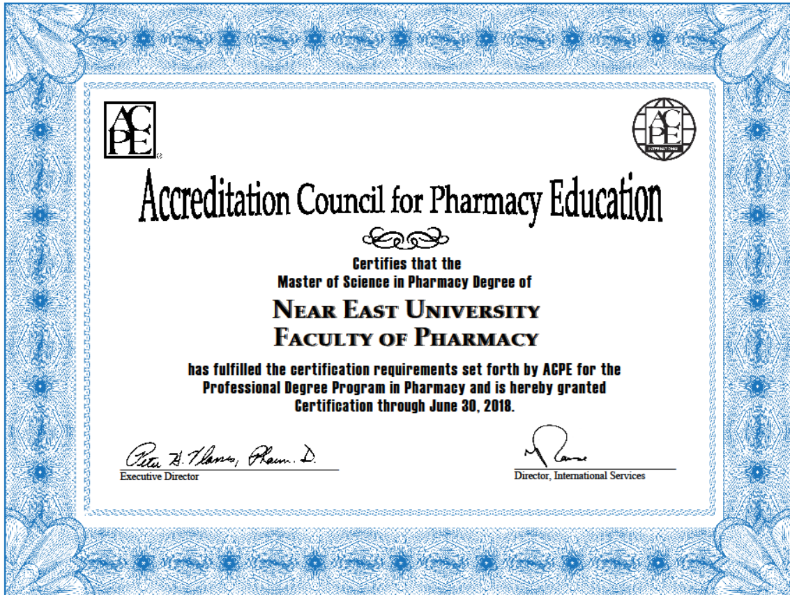
Figure 1. Accreditation Council for Pharmacy Education (USA) certificate.