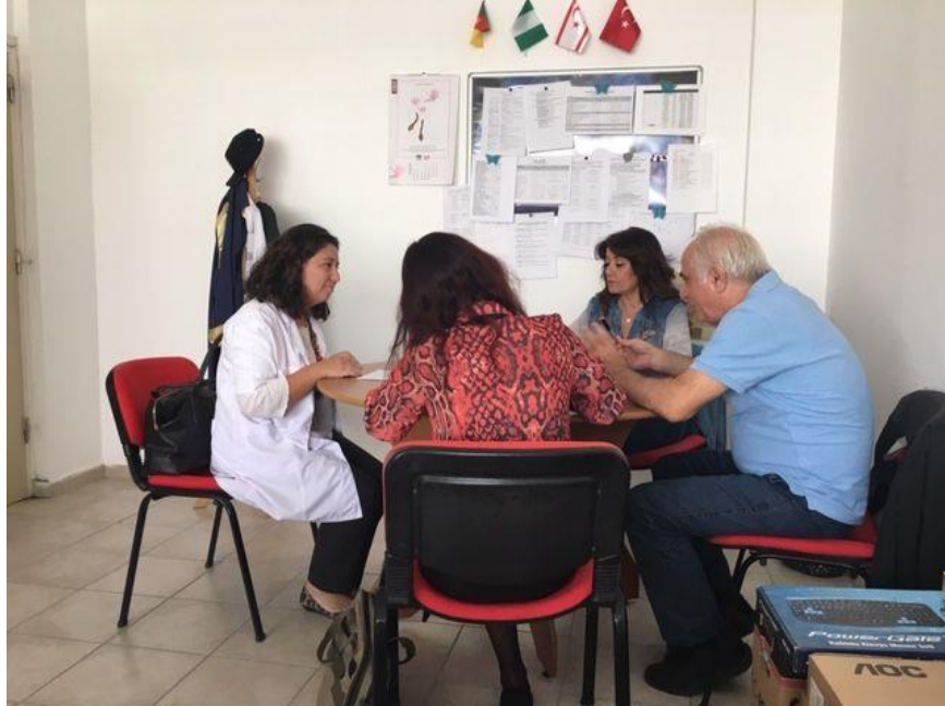
Figure 4. Scene from the Pharmacy Practice oral examination.