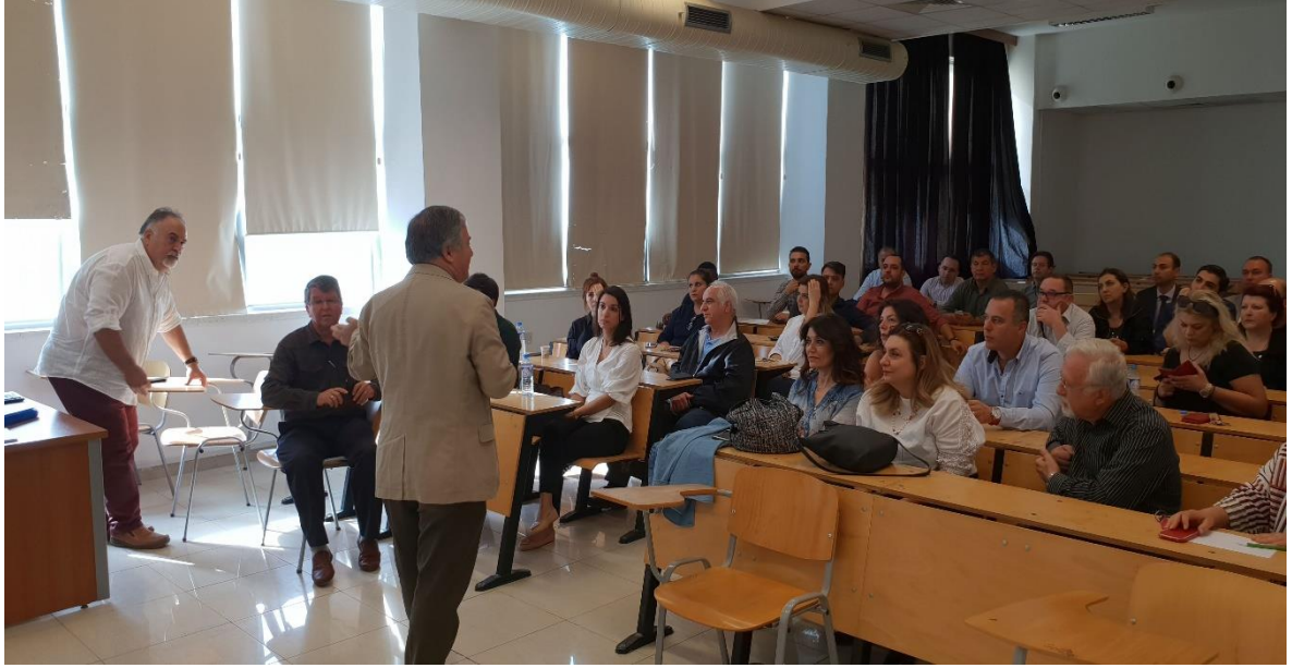
Figure 6. Meeting with jury members before the pharmacy practice exam start.